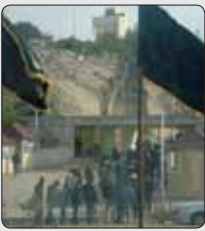
روایتی از سفر کریلا...